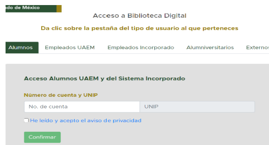
Imagen 3. Tipo de usuarios

3. Una vez elegido alguno de los recursos electrónicos, ingresarás con los datos según tu tipo de usuario